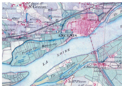
Carte de Coumes, 1863

Ce site est un ensemble de petites parcelles prairiales délimitées par des haies et d'anciennes boires. Le réseau bocager est d'une extrême rareté du fait de la présence de près de 1 000 arbres têtards à l'intérieur du périmètre Natura 2000.