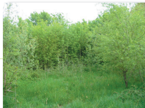
Embroussaillage par les frênes